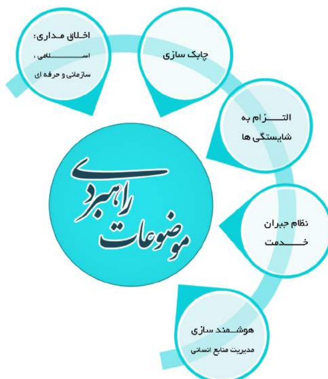
شکل ۲ - موضوعات راهبردی توسعه منابع انسانی شهرداری تهران

در شکل ۲ پنج موضوع راهبردی احصا شده از مقاصد آرمانی توسعه منابع انسانی شهرداری تهران نمایش داده شده است