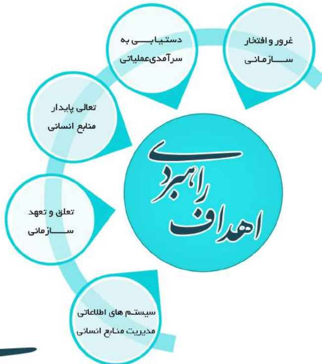
شکل ۳ - اهداف راهبردی توسعه منابع انسانی شهرداری تهران

در شکل ۳ پنج راهبرد احصا، شده از اهداف راهبردی توسعه منابع انسانی شهرداری تهران نمایش داده شده است